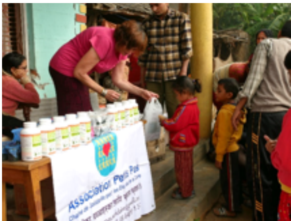
Distribution de Spiruline, de fournitures scolaires à tous les enfants dans un village sinistré.

10,20€ /mois après déduction fiscale (30€ /mois pour parrainer un enfant)