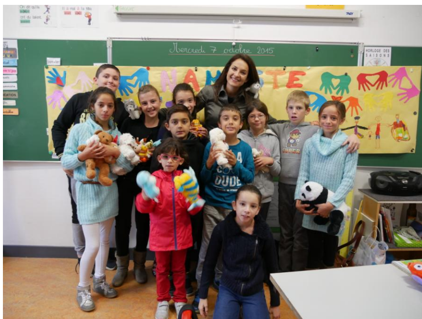
Ecole VICTOR HUGO MANJUSHREE VIDYAPITH de Chapali près de Kathmandou